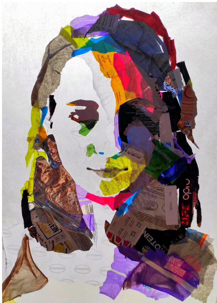
Avtoportret iz smeti (2022) kolaž iz smeti na papirju za peko 56 × 40 cm