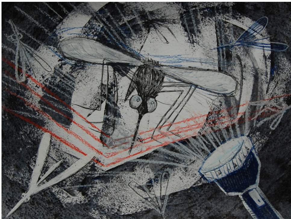
Komarji (2022) akrilne in tempera barve, 2B svinčnik, suhi pasteli ter oljni pasteli na papirju 30 x 40 cm