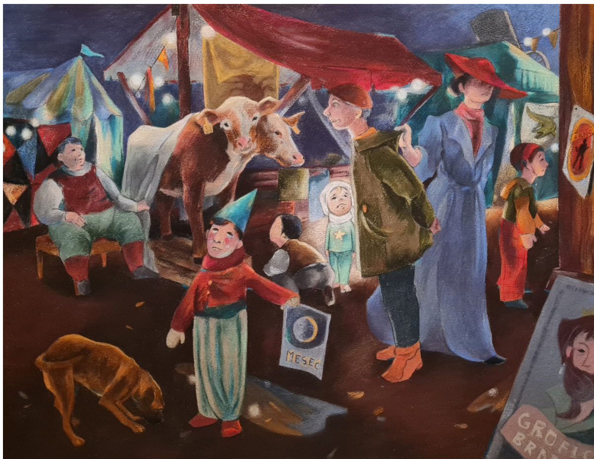
Semn (2023) pastel in oglje na geotekstil 100 x 120 cm