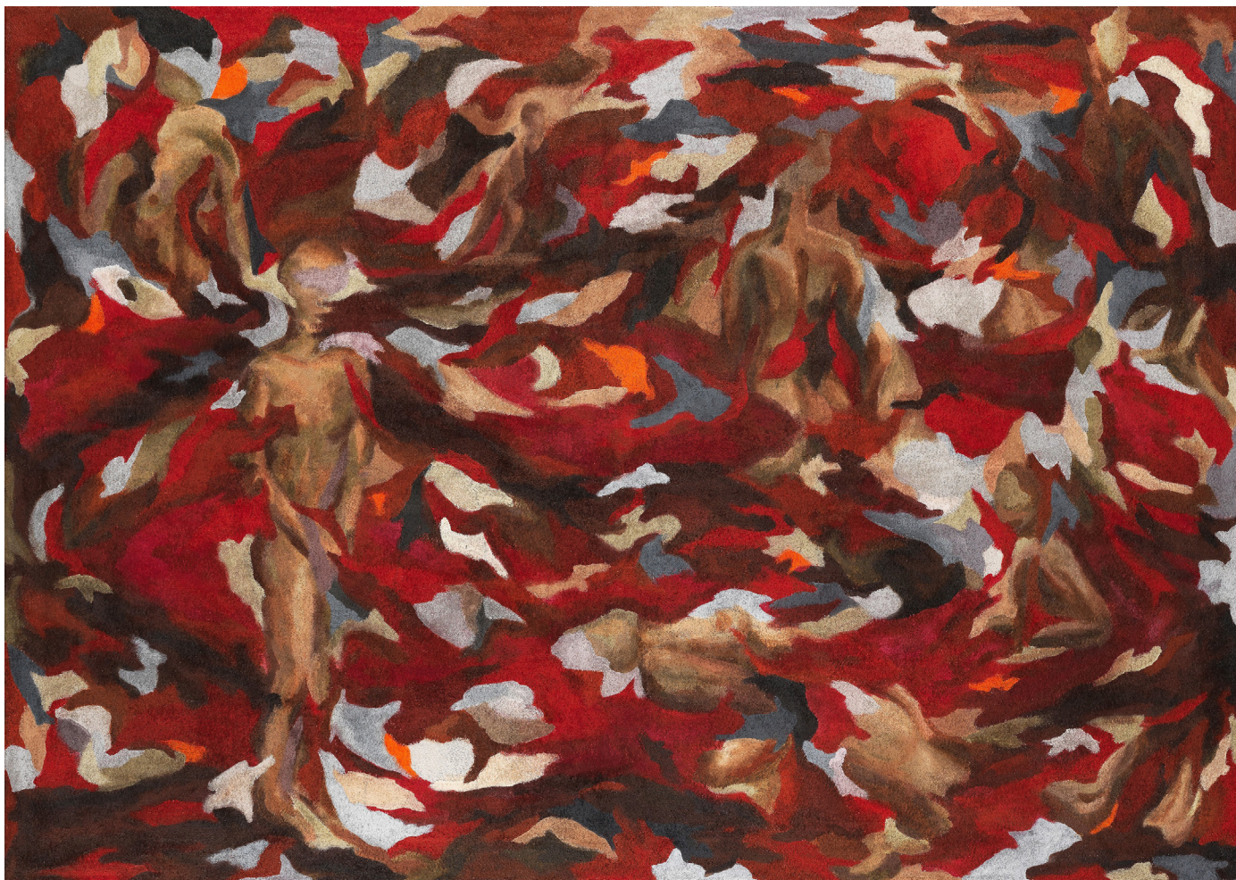
Brez naslova (2023) akril na geotekstil 120 x 170 cm