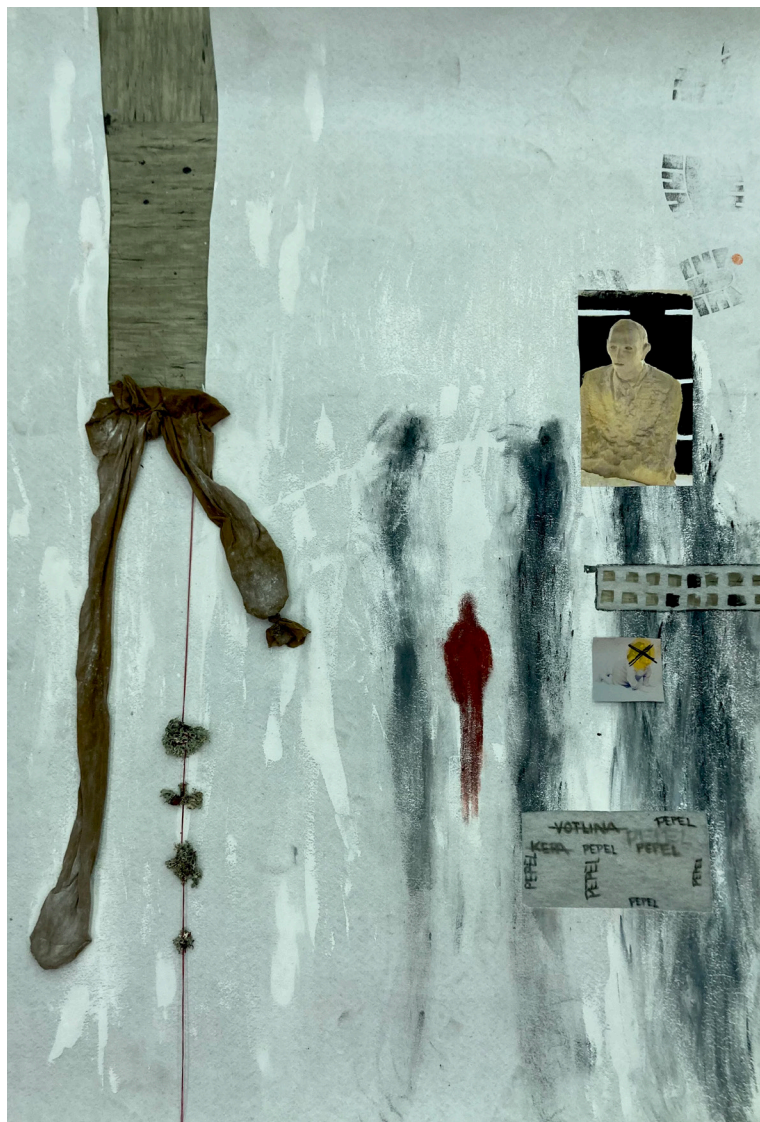
Bela vrana (2022) mešana tehnika na geotekstil 138 x 100 cm