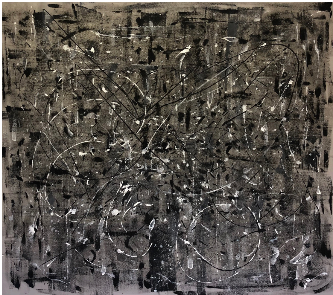
Brez naslova I (2022) akril na geotekstil 143 x 167 cm