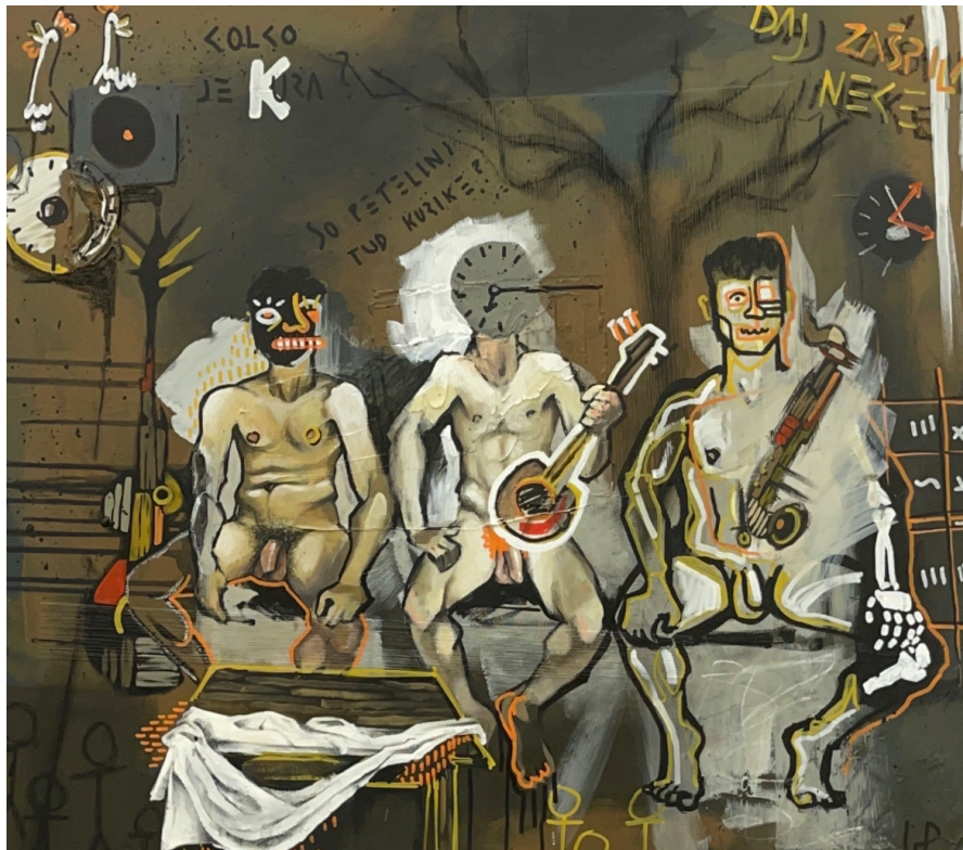
AKTi (2023) mešana tehnika na platno 70 cm x 80 cm