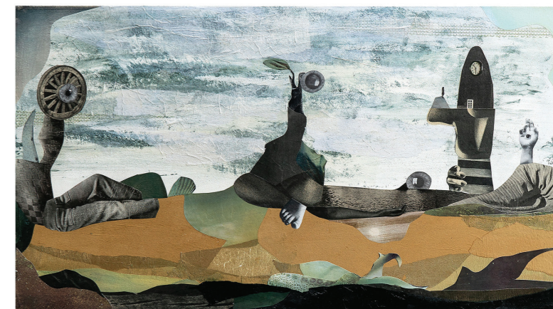
Kronično pozni - Chronically late , 2018, diptih, kolaž na platnu, 2x90x50x2cm