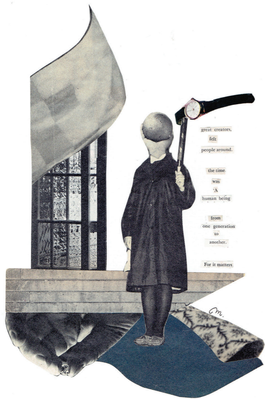
Ne izgubljam časa , 2020, kolaž na papirju, 20x30cm

Razstava bo na ogled od 12. 1. do 11. 2. 2023.