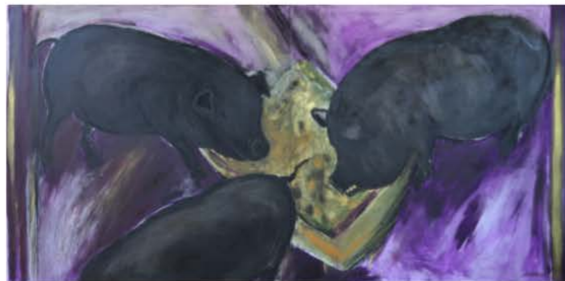
Anka Krašna, Pri koritu , 2007, mešana tehnika na platnu, 130 x 260 cm