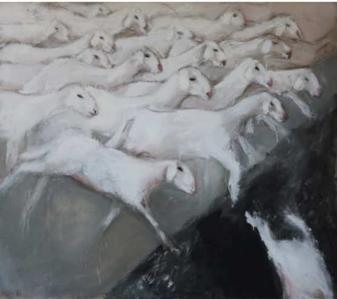
Anka Krašna, Brez naslova , 1987, mešana tehnika na platnu, 130 x 150 cm