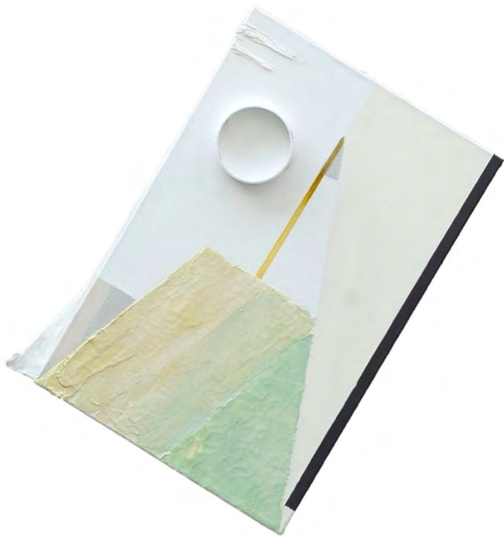
Alenka Žumer, Viewing angle , 2018, mešana tehnika, 70 x 67 cm