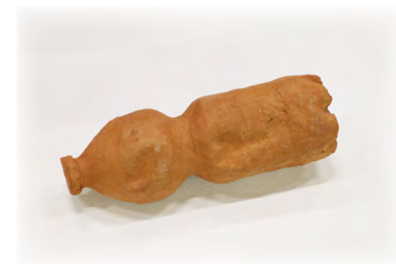
Aljaž Glavina, Plastenka , 2018, tehnika večdelnega kalupa iz mavca in pozitiv iz gline, 4,9 x 19,9 x 6,4 cm