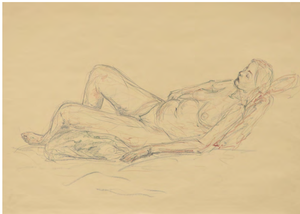
Aljaž Glavina, Ženska figura , 2018, suhe barvice, 49,8 x 69,6 cm, Foto: A. J.