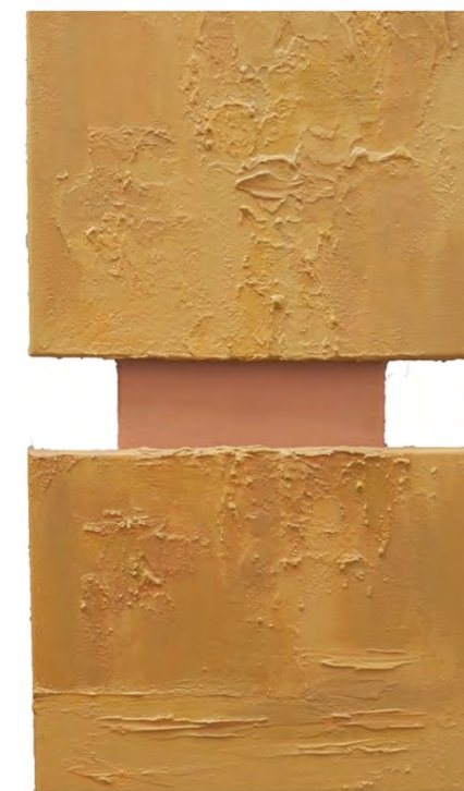
Alenka Žumer, Abecedarian C(olor)C(ontrast) , 2018, mešana tehnika, Foto: A. Ž.

Refleksija na Erasmus izmenjavo: Ljubljana ~ Benetke