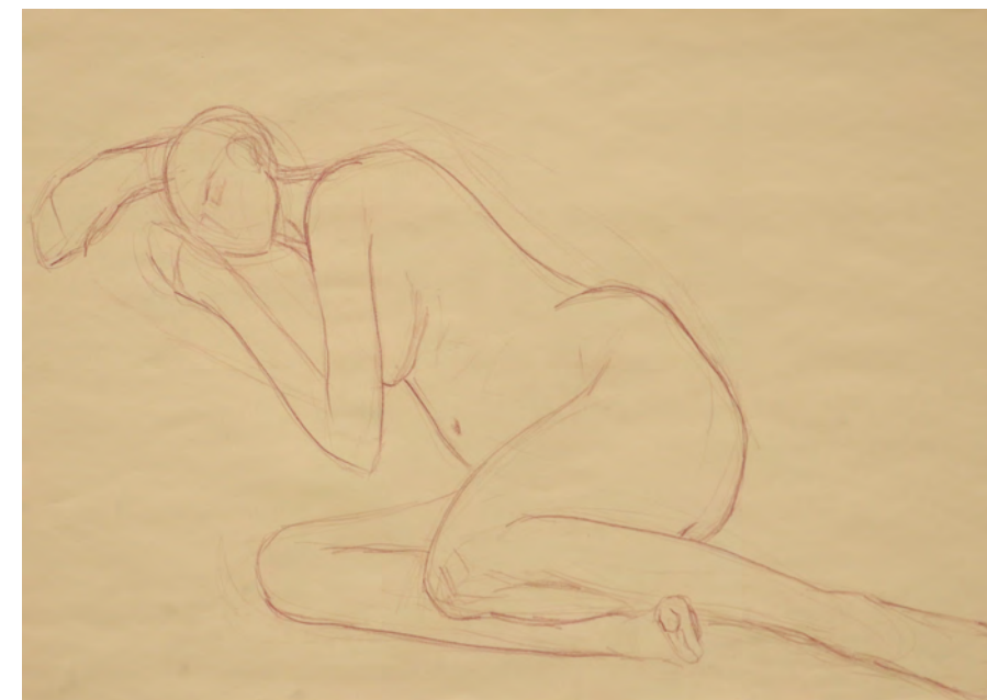
Aljaž Glavina, Ženska figura , 2018, suhe barvice, 49,8 x 69,6 cm, Foto: A. J.

Akademija v Italiji je predstavljala odlično učno okolje za raziskovanje tega vprašanja. Izkušnja je predstavljala obogatitev znanja z novimi poznanstvi na področju umetnosti in je nudila pristne izkušnje s strokovnjaki iz željenega področja. Poleg tega se je lahko prisostvovalo pri izvedbi različnih zahtevnejših likovnih tehnik, predvsem na področju kiparstva. S čimer se je lahko poglobilo praktično znanje.