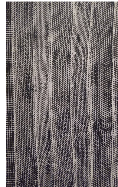
Brez naslova, mešana tehnika, 2015