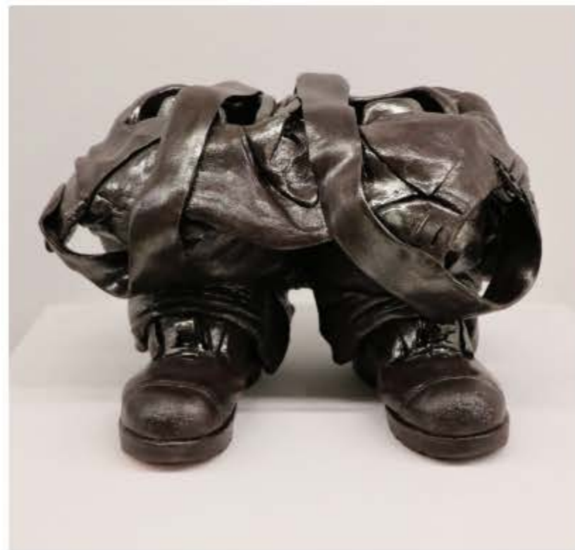
Ana Kavčnik, Stanje pripravljenosti , 2016, glazirana keramika, 36 x 54 x 39 cm.