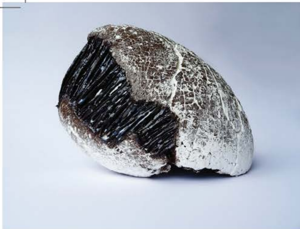
Tamara Bregar, Interlace , 2018, glazirana in engobirana keramika, 32 x 33 x 25 cm.