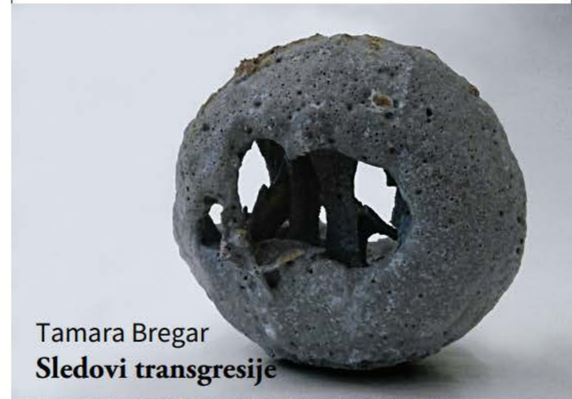
Tamara Bregar Sledovi transgresije