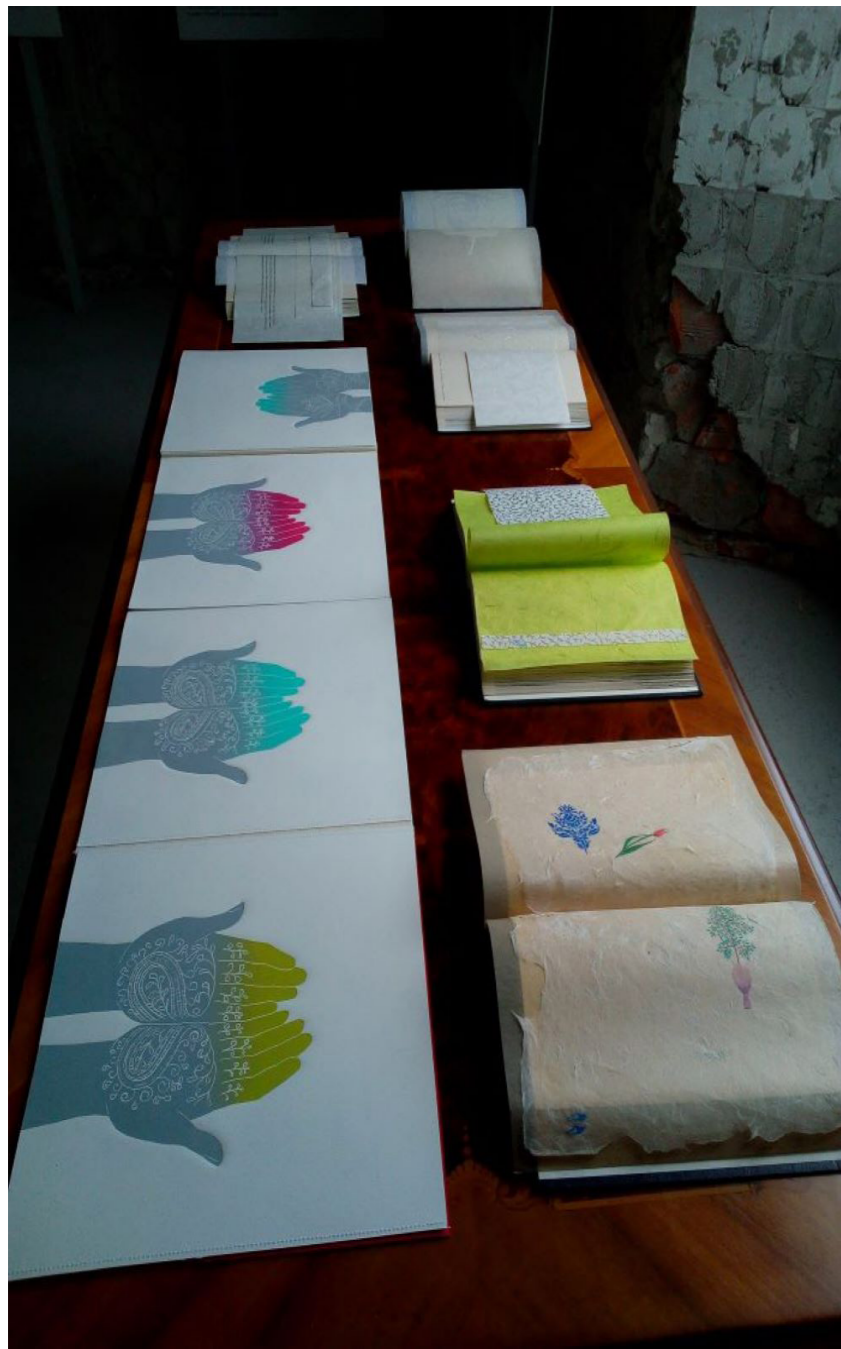
Knjižnica Fany Hausmann, Dvorec Novo Celje, 2021