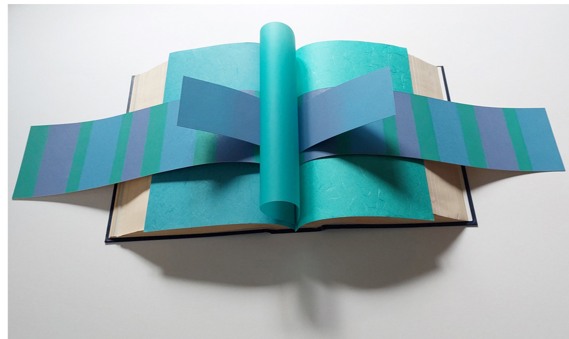
Modra knjiga, 2020, enciklopedija, papir, barvni linorez, 28,5 x 80 x 20 cm

http://www2.arnes.si/~amurat/Zapeljevanje_pogleda.html#ZP9