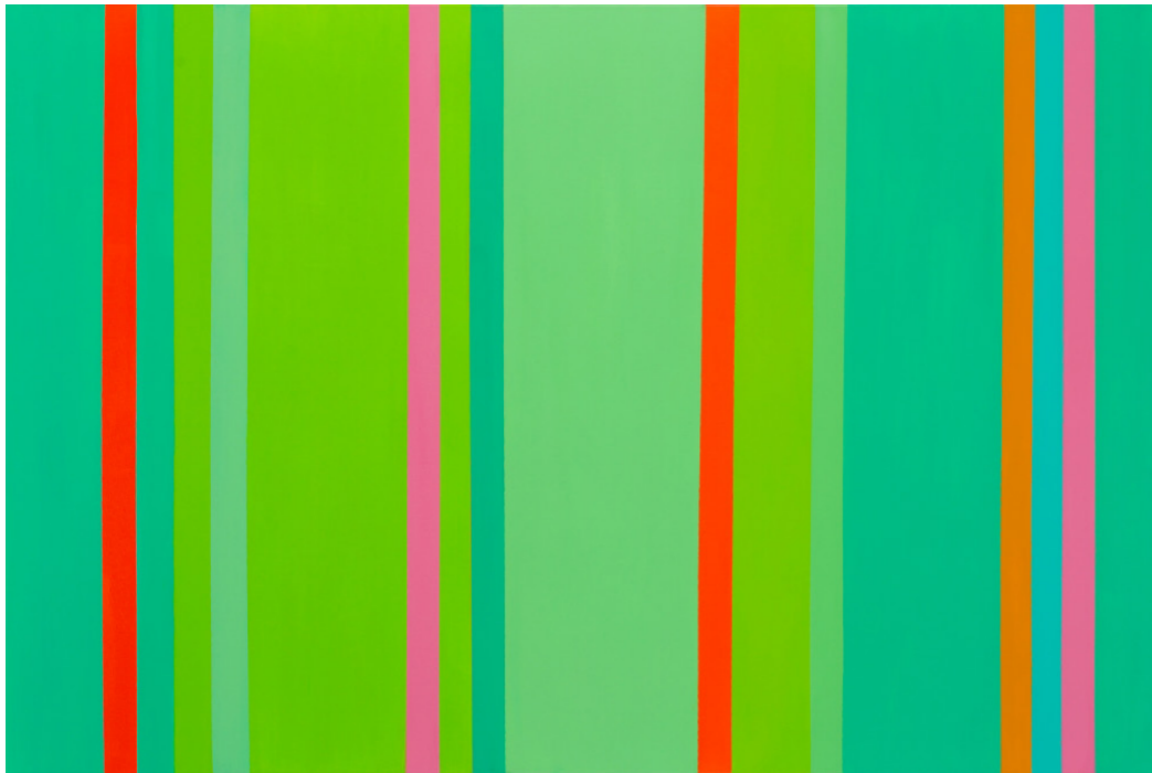
Lovilci časa - Zeleno , 2022, akril na platnu, 100x150 cm

Razstava bo na ogled od 1. 12. 2022 do 9. 1. 2023.